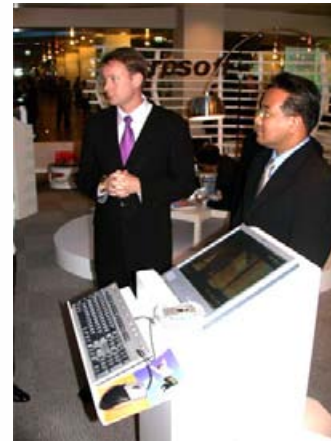
IT WORKS Biometric Showcase