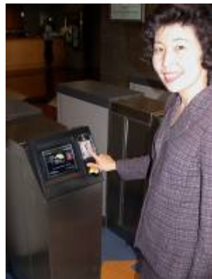
Khun Wiwan Tharahirunchote, Governor- SET

TimeWORKS Solutions for the Stock Exchange of Thailand is currently used for Access Control at the main entrance of the Stock Exchange Building since the APEC Meeting in Oct, 03