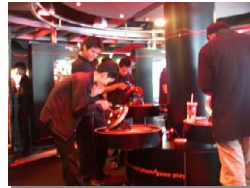
N-GAGE Arena at J-Mart