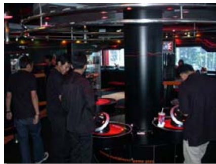
N-GAGE Arena at J-Mart

IT WORKS modified its TimeWORKS Solutions to fit Nokia's requirements. The system was installed in N-GAGE Arena at J-mart store to collect the member fingerprint and works with the rewards points system.