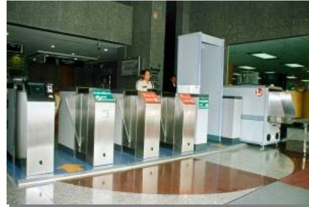
TimeWORKS Fingerprint Auto Turnstile