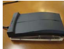
Smart Card Reader