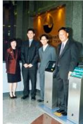
Khun KITTIRATT NA-RANONG- President - SET